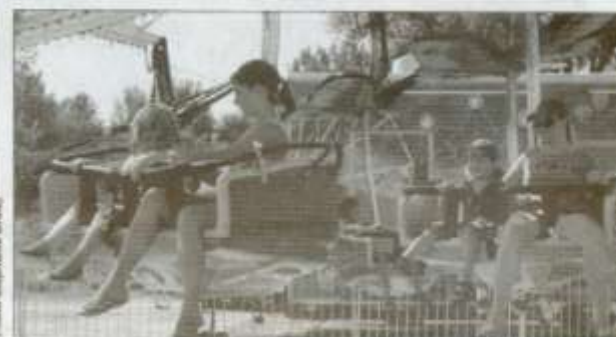
Qui dit exposition agricole, dit manigès.