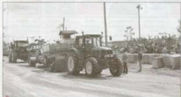
Les concours de tire de tracteurs ont attiré de nombreux visiteurs le samedi 13 août.