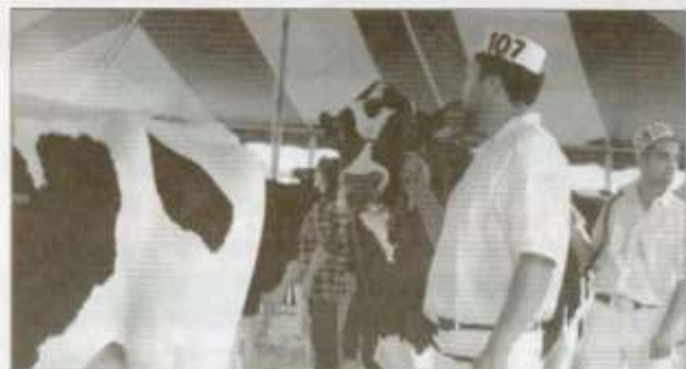
Les jugements d'animaux suscitent toujours beaucoup d'intérêt.