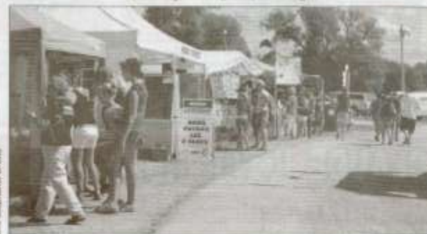
De nombreux kiosques avaient été aménagés sur le site de cette foire agricole qui est la plus vieille du genre au Québec.